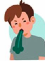
Діарея і блювота