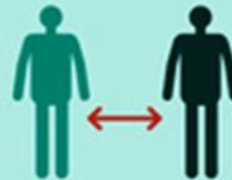
Дотримуйтеся соціальної дистанції