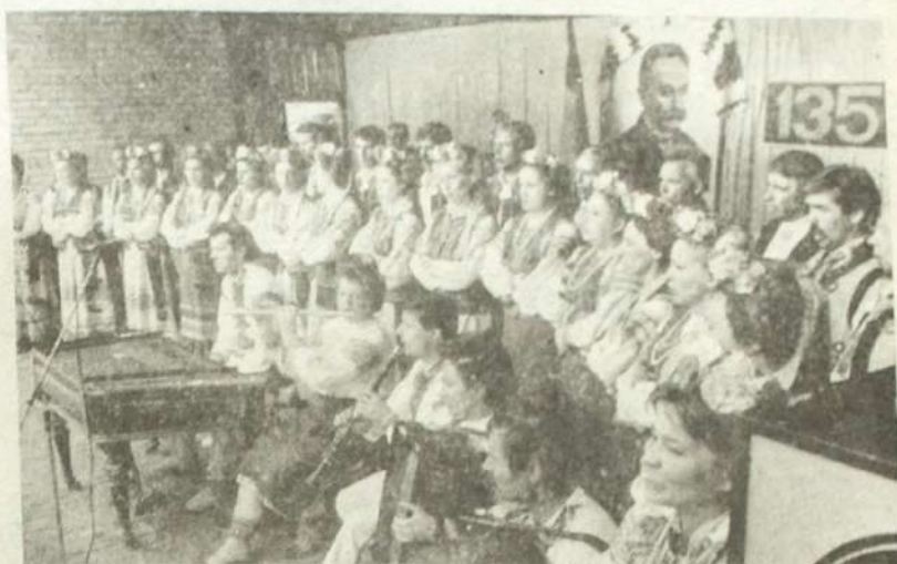
ВІДЗНАЧЕННЯ 135-РІЧЧЯ ВІД ДНЯ НАРОДЖЕННЯ ІВАНА ФРАНКА

систему треба ліквідувати, боре- формувати її практично немож- ливо, не кажучи вже про реор- ганізацію. Незважаючи на те, що компартії пішли навіть на ви- знання Акта про незалежність Ук- раїни, тим не менше, продовжу- ють смертельну боротьбу за збе- реження структур, опираючись на нехай і умовно репартавова- ні КГБ, МВД, СА.